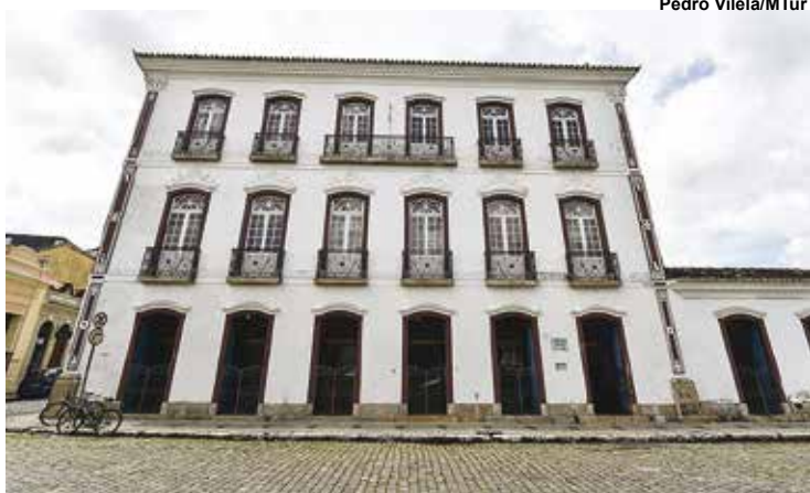
Museu Regional de São João del-Rei (MG)

O tema desta edição "Museus hiperconectados: novas abordagens, novos públicos" propõe uma aproximação das instituições com os visitantes, tanto pelo viés tecnológico