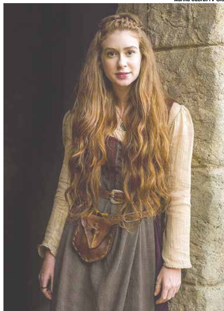
Marina Ruy Barbosa é a Amália na novela Deus Salve o Rei

Entre os temas tratados no livro, há passagens dedicadas