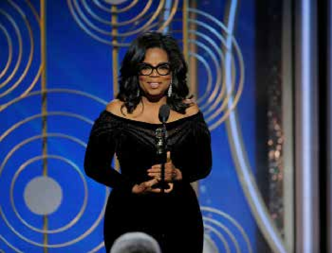
Possível candidata nas eleições presidenciais norte-americanas de 2020, Oprah Winfrey fez forte e emocionante discurso sobre sexismo no Globo de Ouro