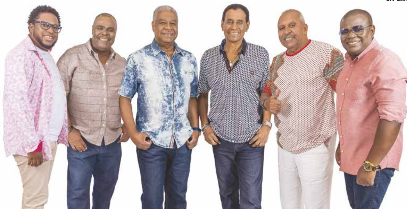
Comemorando 40 anos de carreira como um dos grupos de samba mais respeitados do Brasil, o Fundo de Quintal é atração no Ginásio de Esportes do SESI Marília na próxima sexta, com entrada gratuita

Com capacidade para 1500 lugares (10 para cadeirantes), o Ginásio de Esportes do SESI Marília está localizado na Avenida João Ramalho, 1306. Mais informações: tel. 3401-1500.